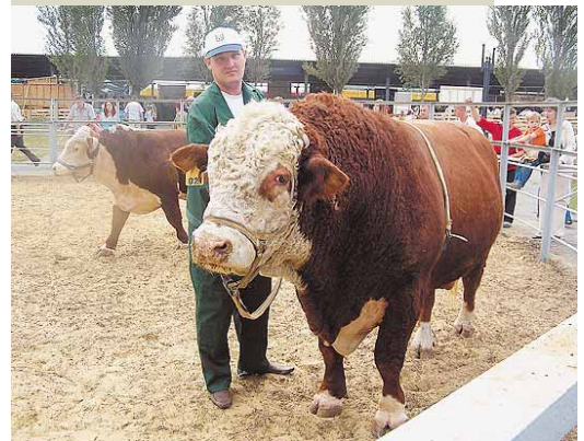
Бык-герейфорд СПК «Белокопанское» — победитель краевой выставки