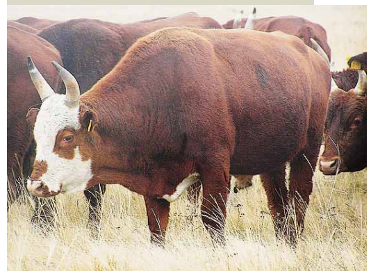
Бык калмыцкой породы СПК «Колхоз-племзавод «Путь Ленина»