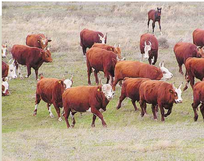
Быки-производители калмыцкой породы