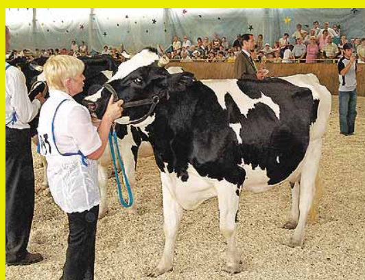
Вице-чемпионка выставки Камелия

продовольствия Московской области, Министерства сельского хозяйства РФ, Росплемобъединения, Некоммерческого партнерства «Моспле́м», ОАО «Московское» по племенной работе отмечали, что с каждым годом растет не только количество участников, но и качество работы подмосковных племенных за-