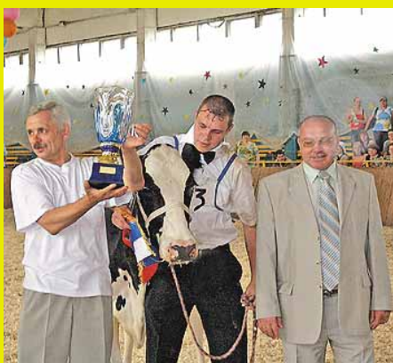
Торжествуют представители племязавода «Коммунарка»: их Чернушка стала абсолютной чемпионкой