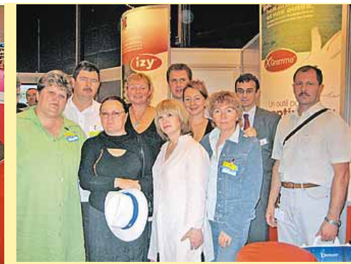
Российские специалисты у стенда компании Tehna