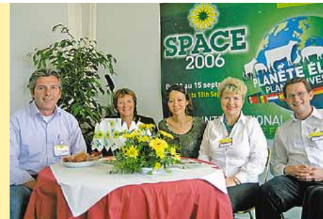
Журналисты из разных стран в пресс-центре Space