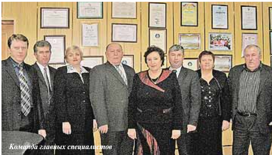
Команда главных специалистов

Новые или отреставрированные запчасти механизаторы получают как бы в кредит: за них еще предстоит отработать. Ну разве будут они после этого небрежно относиться к технике?