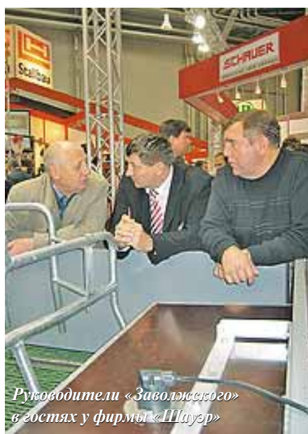
Руководители «Заволжского» в гостях у фирмы «Швауер»

ет три элеватора. В минувшем году «Зерос» собрал 140 тыс. т зерна. Занимаются животноводством: на откормочной площадке под открытым небом содержат 5 тыс. голов крупного рогатого скота симментальской и других пород. Собираются в 2007-м добавить еще 8 тыс. голов.