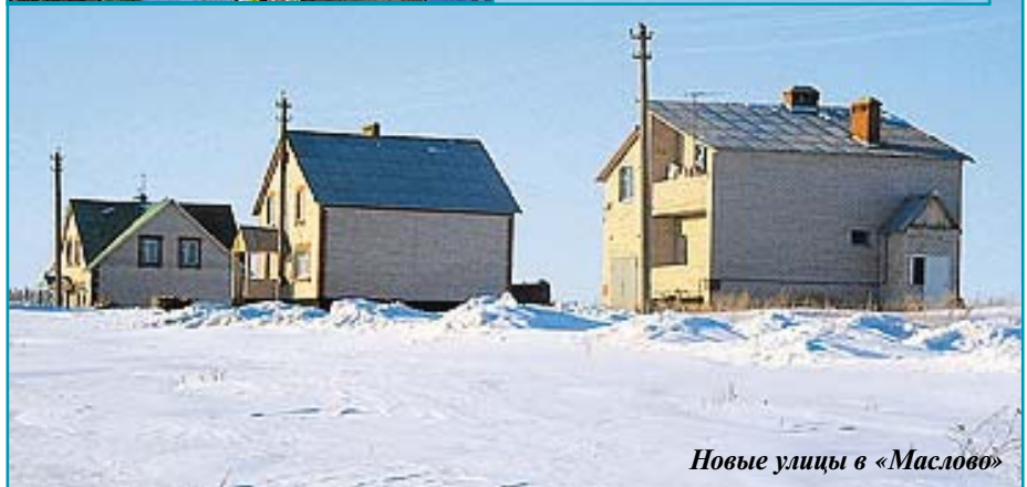
Новые улицы в «Маслово»