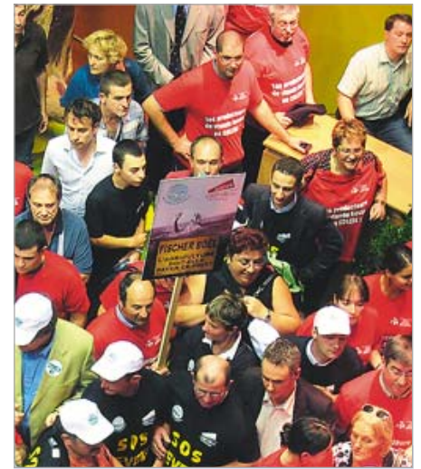
Фермеры — против спада цен на молоко

Цель своей поездки на выставку специалисты обозначили так: ознакомиться с технологиями, которые применяют французские аграрии, понять секреты их успехов, увидеть животных разных пород.