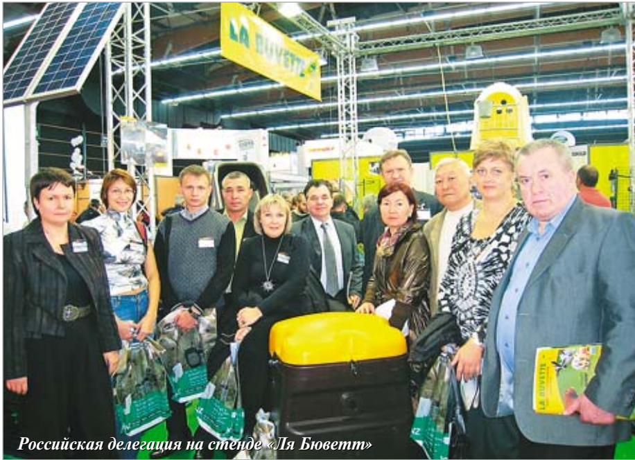
Российская делегация на стенде «Ля Бюветт»