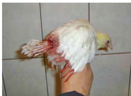
Фото 2. Расклев хвоста у 30-дневного интактного ремонтного петуха

рой — 2762 г, третьей — 2804 г, четвертой — 2799 г, пятой — 2757 г ( фото 1 ).