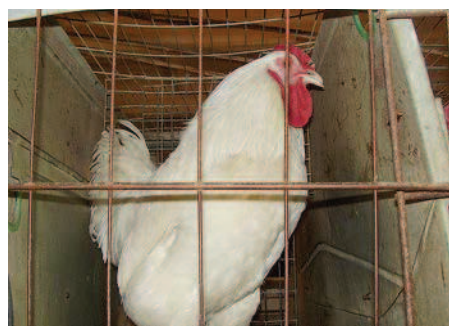
Фото 1. Дебикированный петух-производитель